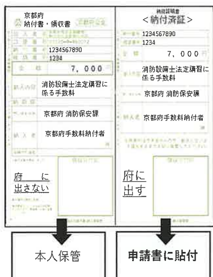
コンビニ・金融機関の場合